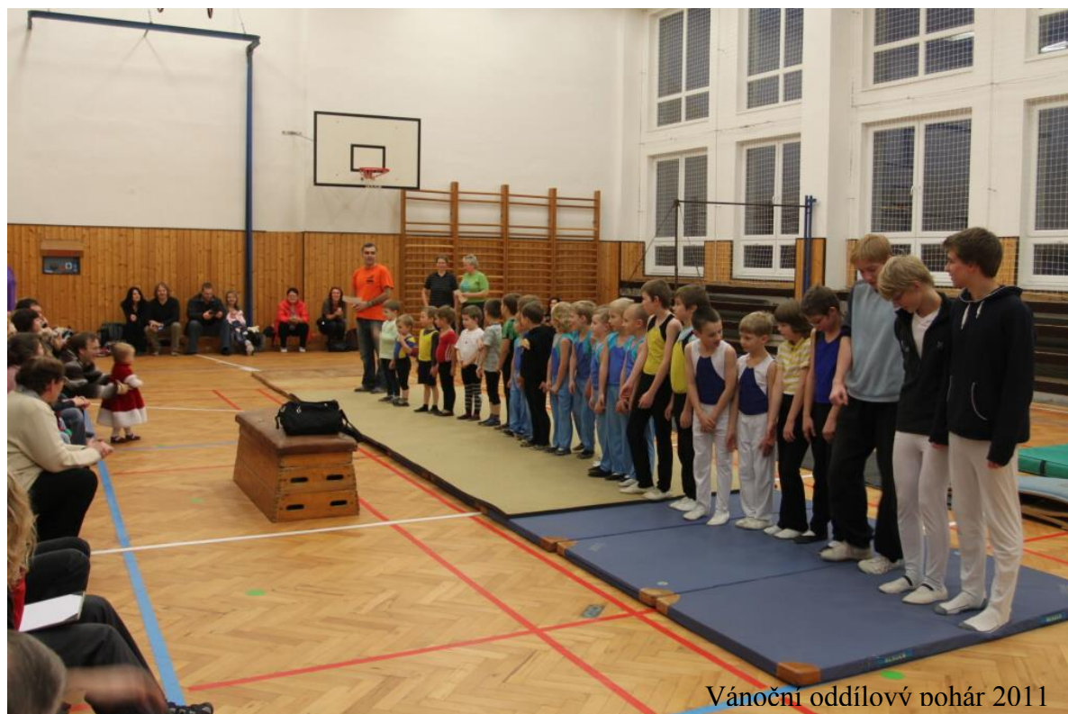
Vánoční oddílový pohár 2011